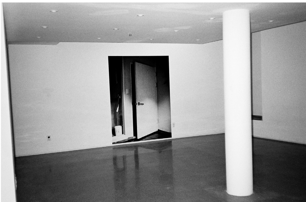
《유적지를 도는 여자들》 전시 기록사진