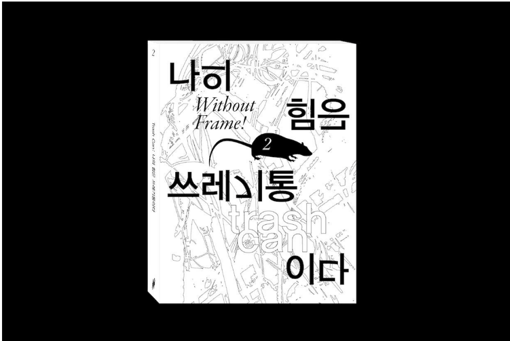
W/O F.(우프), 『Without Frame! Vol.2: 나의 힘은 쓰레기통이다』(2022).

우프와 첫 전시 《모텔전: 눈 뜨고 꾸는 꿈》을 열었다. 2 그건 우리의, 나의 첫 번째 전시였다. 우리의 작업에게 공간이 필요하다면, 그게 전시의 형태라면, 모텔이라는 장소가 필연적이라는 생각을 했다. 그렇게 12시간 동안의 전시를 마치고 나선, 이런저런 다른 전시에서 불리기 시작했다. 다음 해인 2024년, 프리즈 기간을 피해서, 그리고 프리즈 기간에 맞춰서 전시 제안이 들어왔다. 나는 그중 뮤지엄헤드 기획 단체전 《흑백논리》에 참여했고, 3 프리즈 서울 라이브 프로그램(Frieze Seoul LIVE 2024)에서 퍼포먼스형 전시 《정지, Rest》를 열었다.