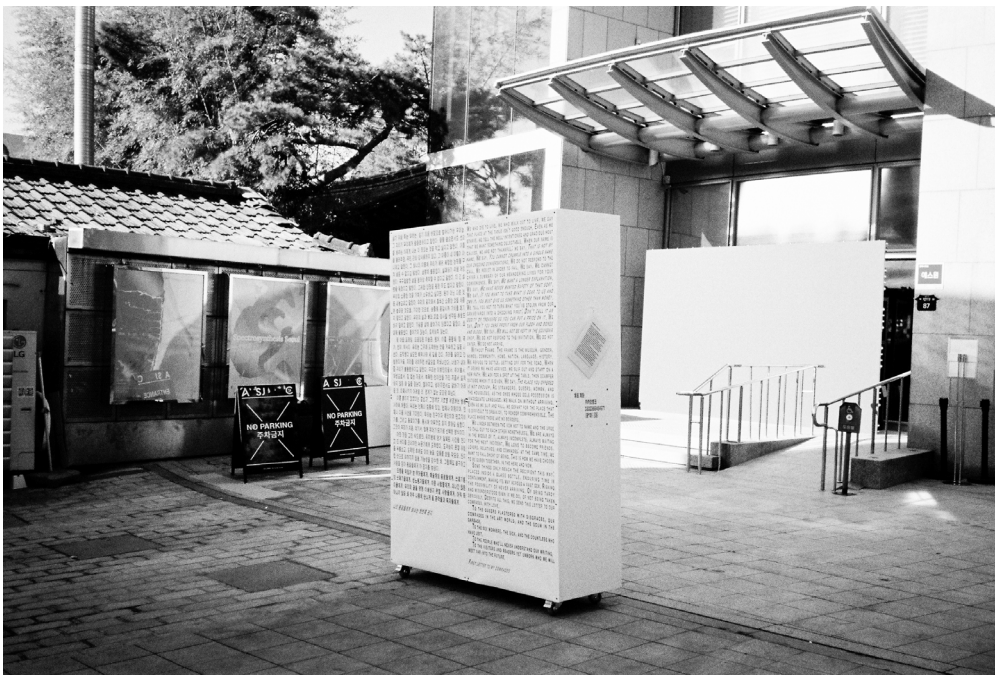
우프의 <나의 동료들에게 보내는 첫 번째 편지> 설치 기록 사진

최근 사람들을 만나면 가장 먼저 듣는 질문은 “왜 아트 선재 전시에서 빠지셨어요?”다. 우프(W/O F.)의 전시 《나의 동료들에게: I am writing to you》를 시작한 이후로 서문을 읽은 사람들, 아트선재센터의 《스펙트로신테시스 서울》 오프닝 날 우프가 설치한 <나의 동료들에게 보내는 첫 번째 편지>를 본 이들은 모두 이런 질문을 가지고 있는 것 같다. 그러니까, ‘읽어봐도 도통 모르겠다. 무슨 말인지...’. 한 줄로 정리할 수 없는, 보이콧이라기엔 애매한, 그래서 선재가 뭐를 어떤 식으로 잘못했다는 건지, 다 읽어보니 책임을 묻겠다는 것도 아닌, 시정을 요구하는 것도 아닌, 아주 길고 잡이야기가 많은 서문. 그래서 그 서문에 대한, ‘참여 안 함’에 대한 물음에 아주 개인적이고 긴 답신을 쓰려 한다.