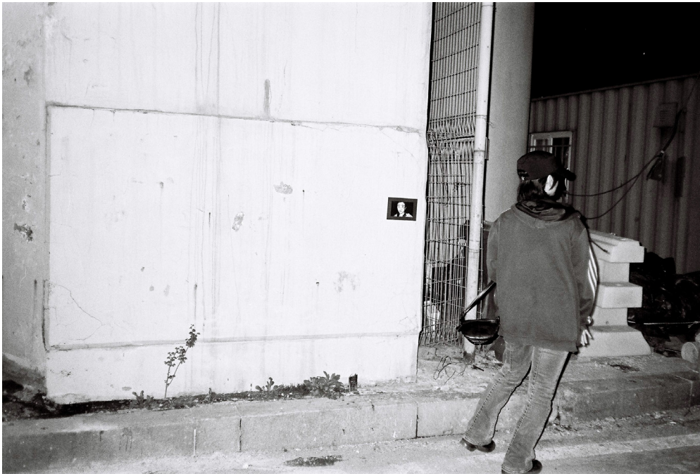
<다크 포스팅> 기록사진 © 홍지영, 2026.